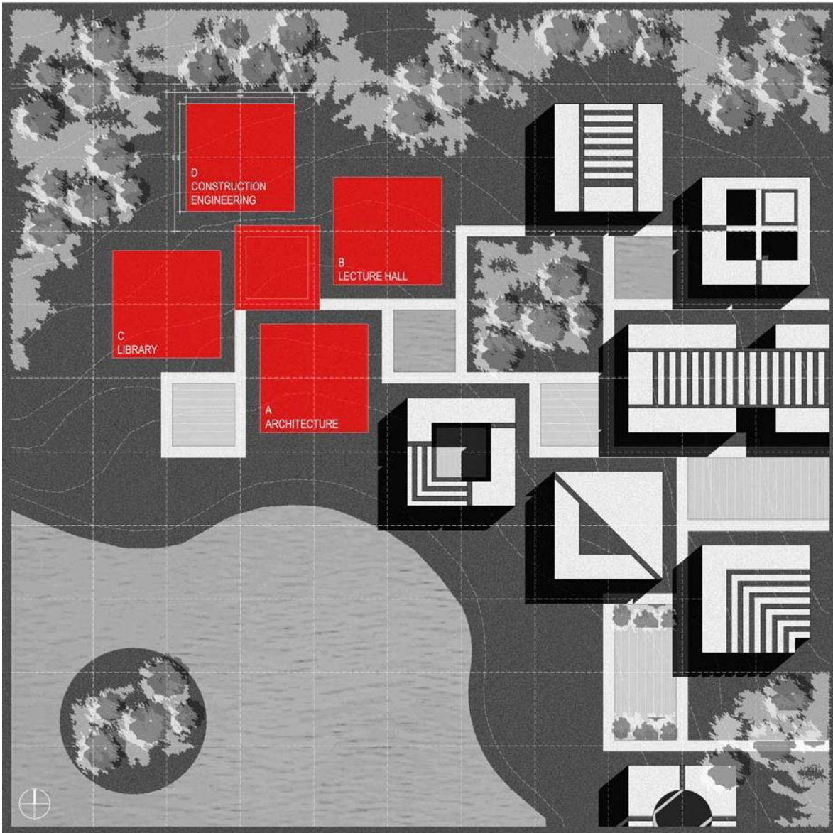
参考场地：中国北方